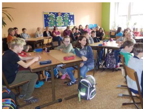
Třída VI.A se těší na hodinu českého jazyka.

I my jsme se velice rádi této akce zúčastnili, protože nám rozvoj škol na Písecku není lhostejný. Toto setkání se uskutečnilo zejména proto,