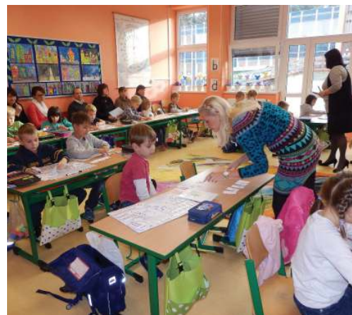
Návštěva hodiny párové výuky na ZŠ Tomáše Šobra.

Během setkání jsme si uvědomily, jak důležitou metodickou i finanční podporu získáváme díky