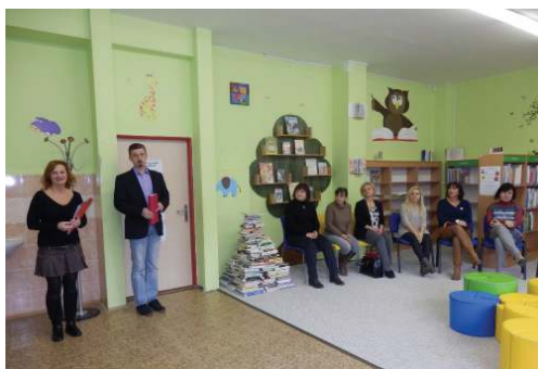
Dopoledne s ukázkami párové výuky začalo v naší pobočce knihovny

Přinášíme čtenářům Píseckého světa dva příspěvky pedagogů ze Základní školy Tomáše Šobra o úspěšných aktivitách pořádaných v tomto školním roce v rámci Místní akční plán rozvoje vzdělávání.